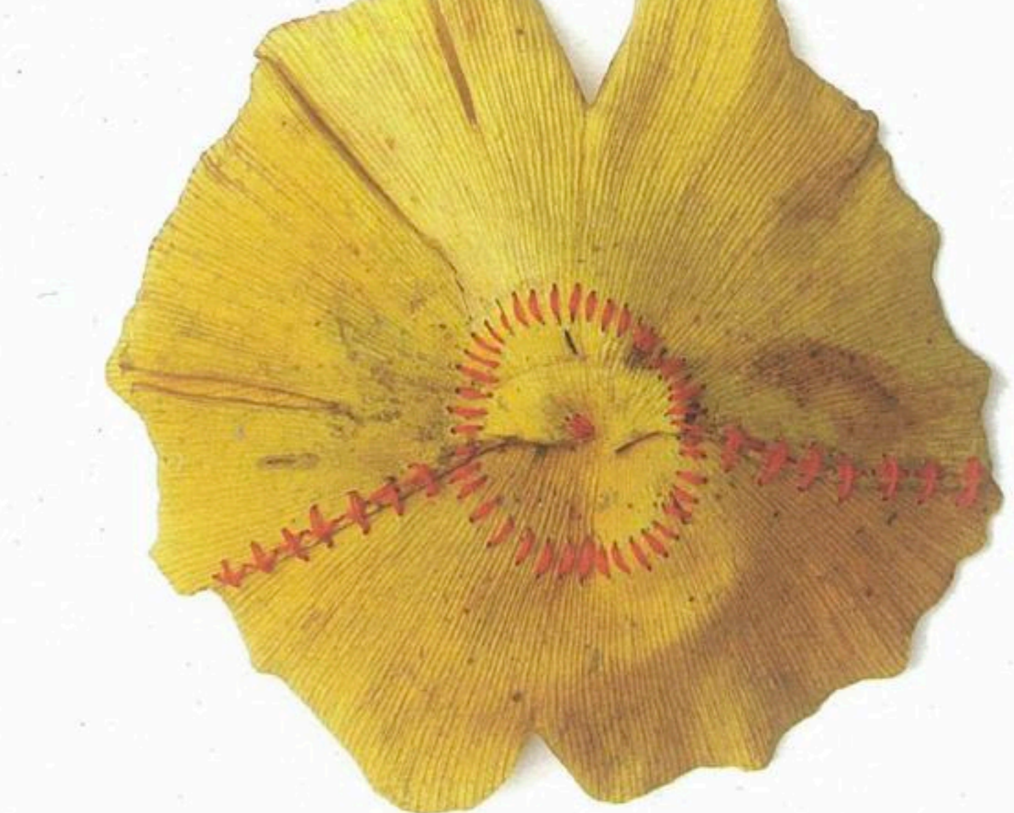
1. Bob Verschuere, Squat.